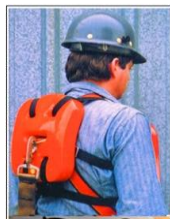
PETROLERO II (ARNES)